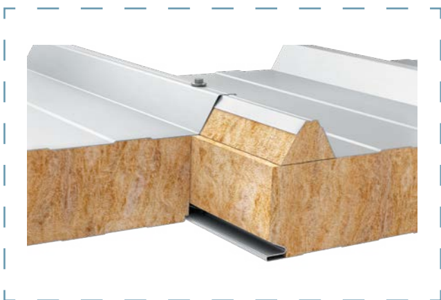
Schemat łączenia płyt